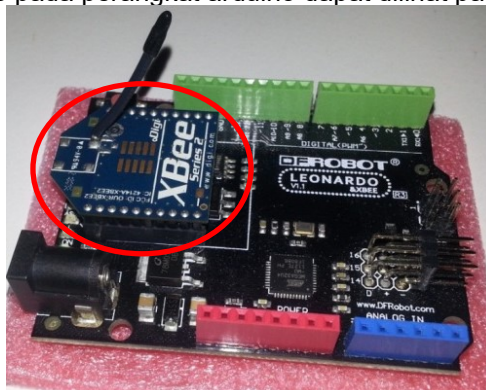
Gambar 1 Pemasangan modul xbee pada perangkat arduino

Pada tahapan ini dilakukan pemasangan modul xbee pada perangkat arduino dengan menempatkan modul xbee pada socket xbee yang tersedia pada perangkat arduino. Pemasangan modul xbee pada perangkat arduino dapat dilihat pada Gambar 1.