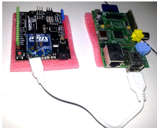
Gambar 3 Pemasangan arduino pada raspberry

Pada tahapan ini raspberry akan dihubungkan dengan arduino, untuk menghubungkannya yaitu dengan menggunakan kabel data USB to Data. Socket USB pada raspberry dihubungkan dengan socket data pada arduino. Pemasangan perangkat arduino pada raspberry dapat dilihat pada Gambar 3.