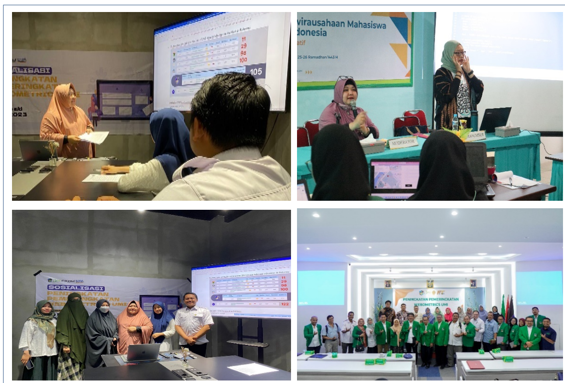
Gambar 2. Dokumentasi Kegiatan Pelatihan