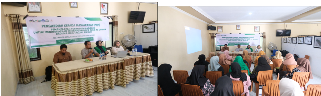
Gambar 3. Sosialisasi Pelaksanaan Kegiatan

Pelaksanaan program diawali dengan sosialisasi ( Gambar 3 ) untuk membangun kesepahaman bersama dengan mitra yang dihadiri Kepala Desa Borikamase.