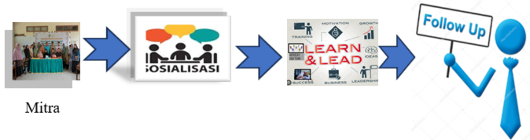
Gambar 2 Tahapan Pelaksanaan Kegiatan

Berdasarkan hasil diskusi dengan mitra, tim pengabdian akan memberikan pelatihan dan meningkatkan literasi teknologi dan kemampuan baca tulis al Qur'an Metode yang digunakan adalah sosialisasi, praktikum, mitra langsung mempraktekkan penggunaan aplikasi android dalam belajar baca tulis al Qur'an Pendekatan yang ditawarkan untuk penyelesaian oleh tim pengabdian atas masalah prioritas yang dihadapi Majelis Taklim An Nur Desa Borikamase. Adapun Gambar 2 merupakan tahapan pelaksanaan kegiatan.