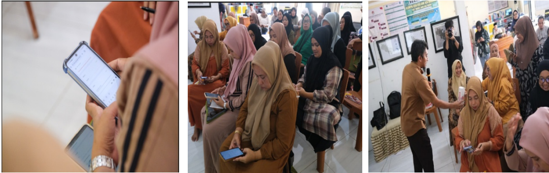
Gambar 4. Pengisian link.umi.ac.id/Pre-Test-PKM-Desa-Borikamase-2025.