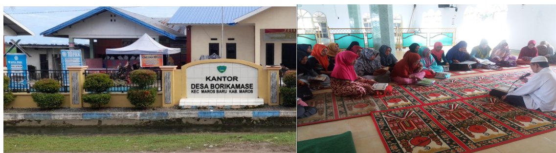
Gambar 1. Kantor Desa Borikamase dan Berbagai Kegiatan Majelis Taklim An Nur Desa Borikamase

Desa Borikamase berpenduduk sekitar 3.991 jiwa, terdiri dari 1.994 laki-laki dan 1.997 perempuan. Agama Islam merupakan agama yang dianut oleh mayoritas masyarakat Desa Borikamase [1], [2], [3].