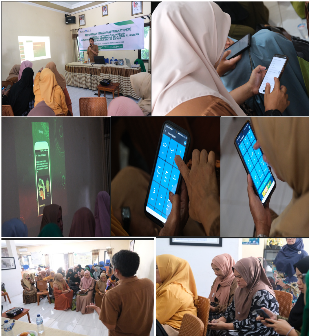
Gambar 6. Pelatihan Penggunaan Aplikasi Android dalam Baca Tulis Al Qur'an

step-by-step instruction dan praktik langsung.,