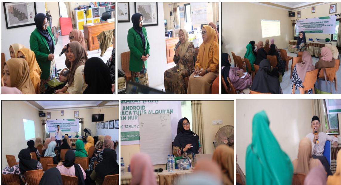
Gambar 5. Pelatihan Baca Tulis Al Qur'an