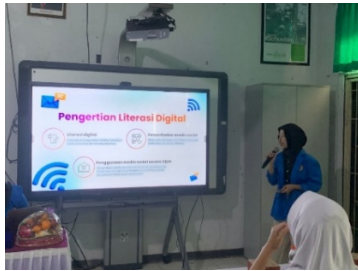
Gambar 1 Sesi Pemaparan Materi Inti dan Diskusi Interaktif Bersama Kakak Narasumber