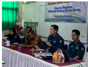
Gambar 3 Pembukaan Resmi Kegiatan Yang Mengawali Seluruh Rangkaian Acara

Selain faktor kejenuhan waktu, tim pelaksana juga dihadapkan pada kendala teknis berupa tidak adanya dukungan sistem audio (sound system) di lokasi kelas pada saat sesi penayangan video promosi perguruan tinggi dilaksanakan. Menanggapi situasi tersebut, tim pelaksana menerapkan strategi improvisasi berupa live narration (narasi langsung). Mahasiswa bertindak sebagai pengisi suara manual untuk menjelaskan alur visual, pesan tersembunyi, dan teknik storytelling dalam video promosi kampus tersebut. Langkah tak terduga ini justru berhasil membalikkan situasi, mengubah tayangan satu arah menjadi ruang bedah konten yang interaktif.