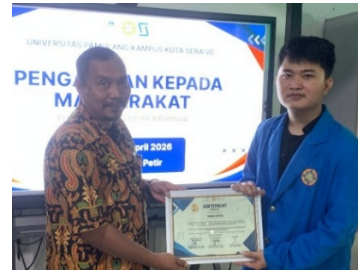
Gambar 2 Penyerahan Cenderamata Sebagai Bentuk Apresiasi Kepada Narasumber