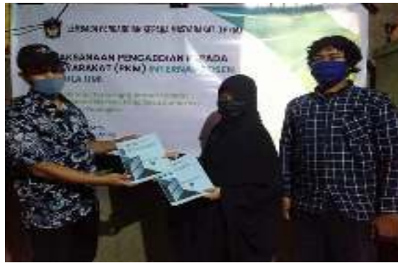
Gambar 2. Serah terima panduan penggunaan aplikasi

Selanjutnya adalah kegiatan pelatihan pengelolaan dokumen desa berbasis teknologi informasi. Staf desa, terutama yang menangani persuratan desa sangat antusias karena merasa aplikasi yang dipresentasikan lebih simple dan lebih mudah dijalankan dibandingkan dengan aplikasi yang sudah ada. Kelebihan lain dari aplikasi informasi desa ini adalah dapat dijalankan diberbagai flatform dan device. Gambar 3 menampilkan suasana pemaparan materi dan antusias dari peserta dalam mengikuti pelatihan.