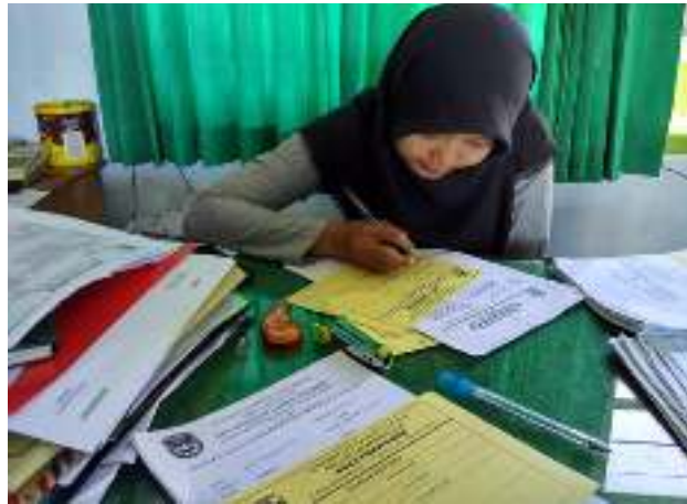
Gambar 1. Contoh kegiatan pengarsipan

Pengelolaan diartikan sebagai suatu rangkaian pekerjaan atau usaha yang dilakukan oleh sekelompok orang untuk melakukan serangkaian kerja dalam mencapai tujuan tertentu [9]. dalam pengelolaan dokumen seperti persuratan maupun pengarsipan yang dilakukan oleh mitra masih secara konvensional. Surat masuk dan keluar maupun pengarsipannya dilakukan secara manual menggunakan buku besar. Dengan model seperti ini, peluang nomor surat ganda sangat besar atau bisa juga tidak sesuai dengan hal dari surat tersebut. Bukan hanya itu, dalam hal pelaporan juga akan menyulitkan karena hanya dicatat pada buku besar. Pengarsipan adalah suatu proses mulai dari penciptaan, penerimaan, pengumpulan, pengaturan, pengendalian, pemeliharaan, dan perawatan serta penyiapan arsip menurut sistem tertentu [7] Gambar 1 menampilkan contoh kegiatan pengarsipan yang dilakukan secara konvensional.