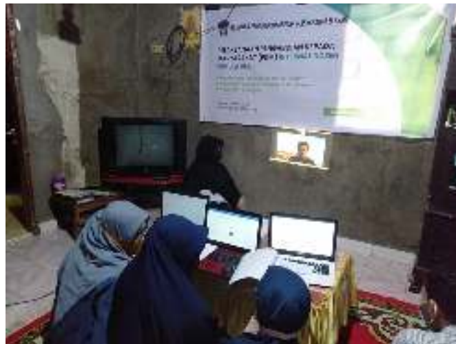
Gambar 3. Kegiatan pelatihan

Selanjutnya adalah kegiatan pelatihan pengelolaan dokumen desa berbasis teknologi informasi. Staf desa, terutama yang menangani persuratan desa sangat antusias karena merasa aplikasi yang dipresentasikan lebih simple dan lebih mudah dijalankan dibandingkan dengan aplikasi yang sudah ada. Kelebihan lain dari aplikasi informasi desa ini adalah dapat dijalankan diberbagai flatform dan device. Gambar 3 menampilkan suasana pemaparan materi dan antusias dari peserta dalam mengikuti pelatihan.