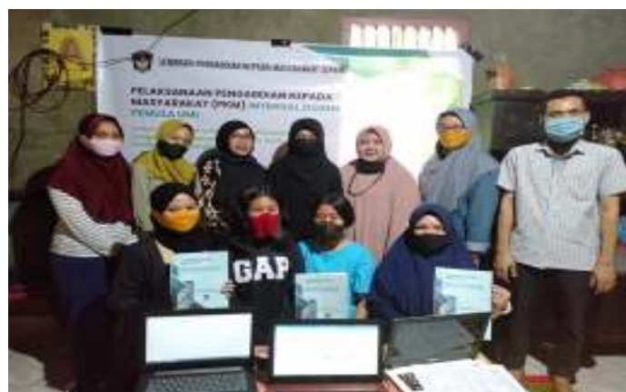
Gambar 4. Foto bersama peserta

Selanjutnya adalah penutupan kegiatan pelatihan. Setelah pemberian cendramata, kemudian diakhiri dengan sesi foto bersama. Gambar 4 menampilkan kegiatan tersebut.