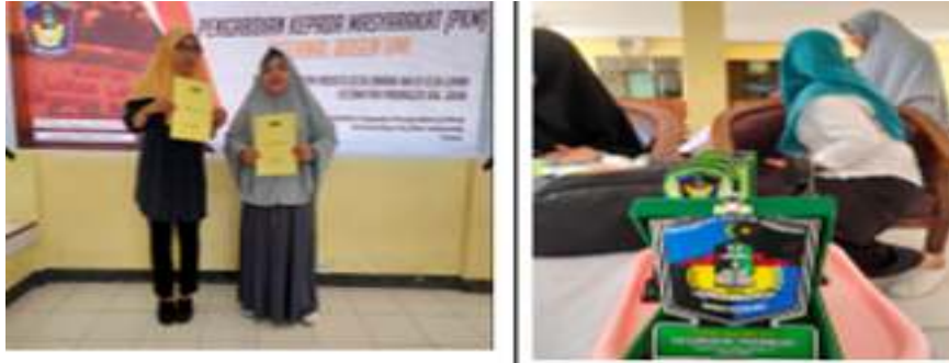
Gambar 7. Mitra mendapatkan Modul dan Web