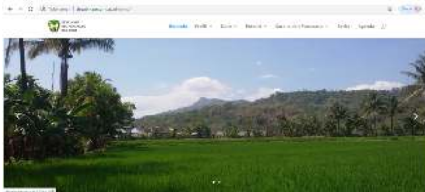
Gambar 4. Web Desa