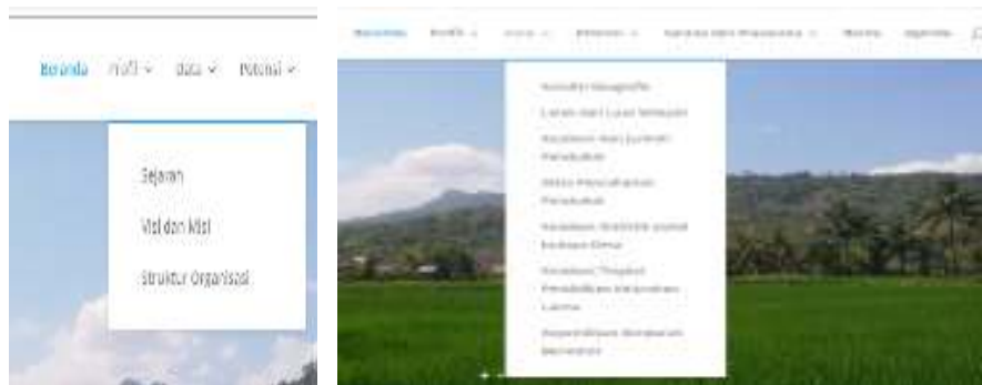
Gambar 5. Pengelolaan informasi