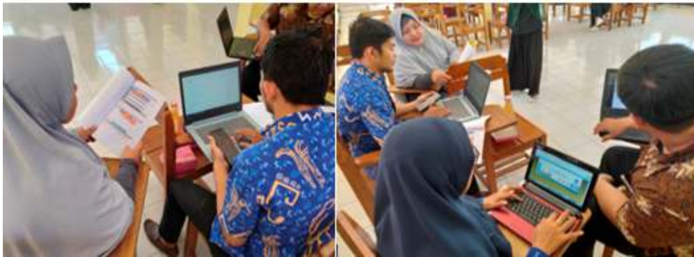
Gambar 2. Pelatihan Perangkat Desa