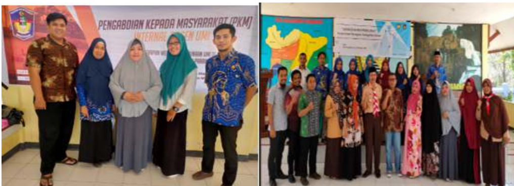
Gambar 3. Trampil Perang Desa

Mewujudkan kelurahan Lanna menuju kelurahan andalan dikabupaten Gowa dan sejajar dengan kelurahan lainnya di Sulawesi Selatan dalam mensejahterakan masyarakat lahir dan batin.