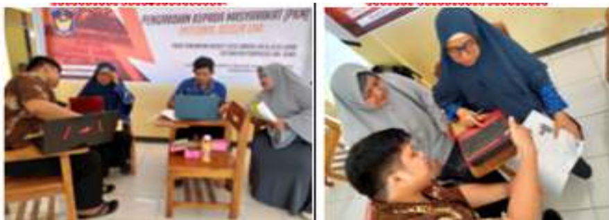
Gambar 6. Pengelolah Web