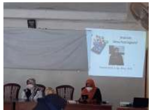
Gambar 2: Proses Pemberian materi