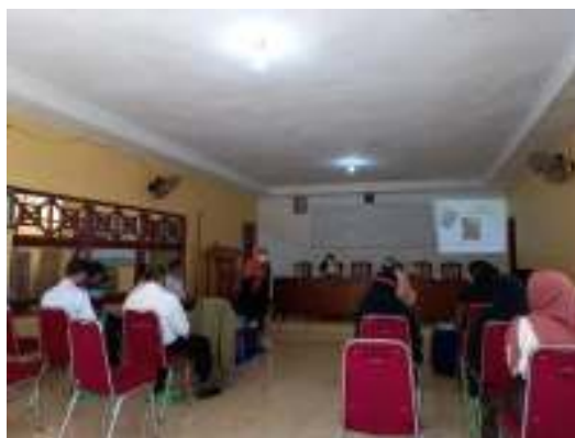
Gambar 1 : Penyuluhan di Aula Kantor Desa

Pelaksanaan kegiatan Hari II juga dirangkaikan dengan pembagian leaflet dan media agar Masyarakat dapat memahami melalui media gambar.